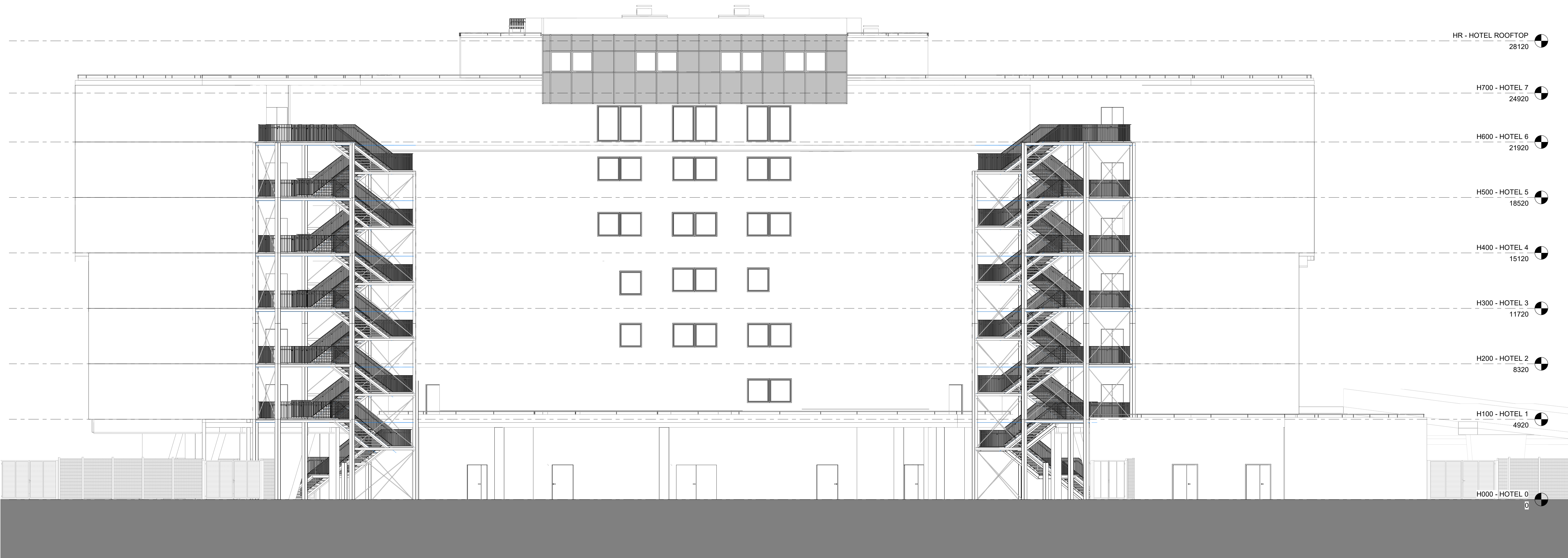
1 PROSPETTO SUDEST 1 : 100